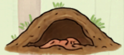
NORA POD ZIEMIĄ