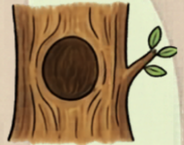
DZIUPŁA W DRZEWIE