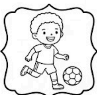
Granie w piłkę